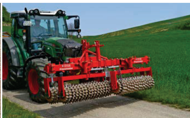
Mediana en frontal à la place d'une masse morte