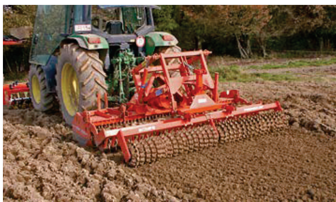
Mediana 32 E