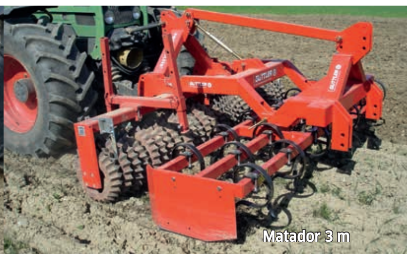
Matador 3 m

Préparation des semis derrière la rotative