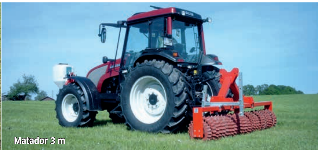
Matador 3 m

Idéal aussi en prairie: favorise le tallage, plombage des semences au sursemis, hauts rendements