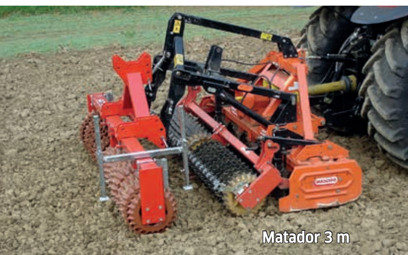
Matador 3 m