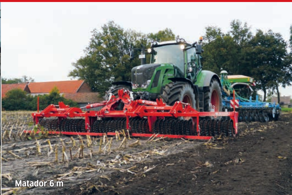
Matador 6 m

Lutte efficace contre la pyrale du maïs avec un rendement ha/heure énorme et une consommation réduite