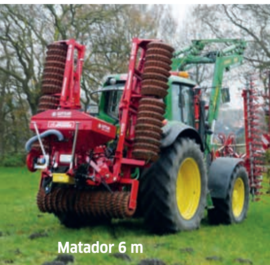
Matador 6 m

Les résultats concluants de cette combinaison ont fait parler de nous, si bien que nous gagnons chaque jour de nouveaux clients.“