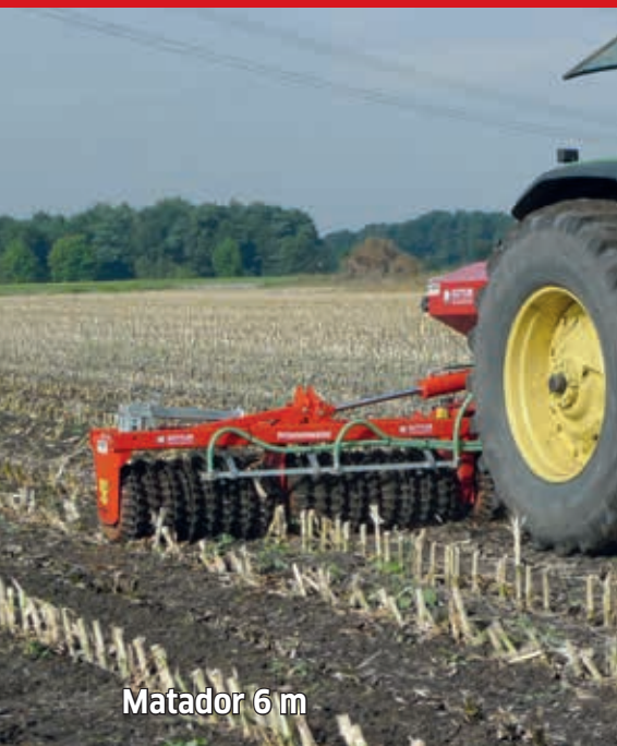
Matador 6 m