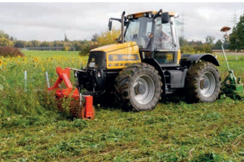
Destruction d'engrais verts avant le travail du sol