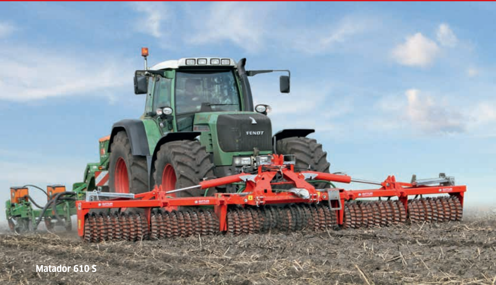
Matador 610 S