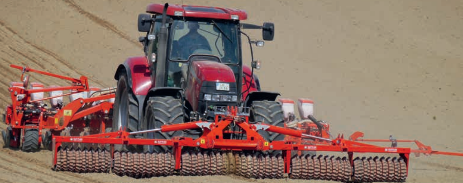
Matador 610 S