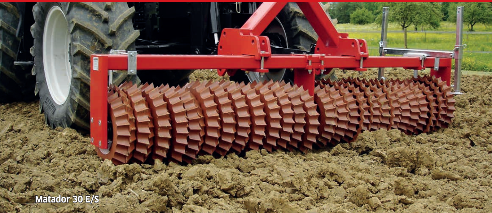
Matador 30 E/S

Pour la préparation du lit de semences, attelage avant et arrière