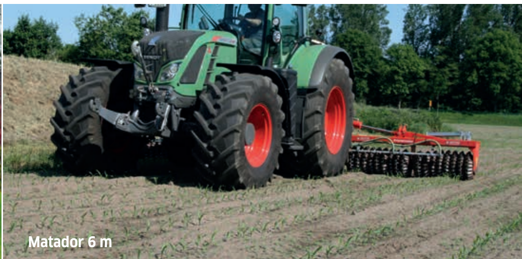
Matador 6 m

Culture intermédiaire en maïs (ou céréales) – culture sous couvert, etc.