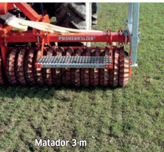
Matador 3 m

Les résultats sont excellents: une préparation du lit de semences idéale, pour une levée homogène et des rendements élevés. Même avec des précipitations de 1300 mm par an, la battance n'est pas un problème pour nous. Mon scepticisme initial a maintenant cédé la place au sentiment d'un bon investissement dans mon entreprise.“