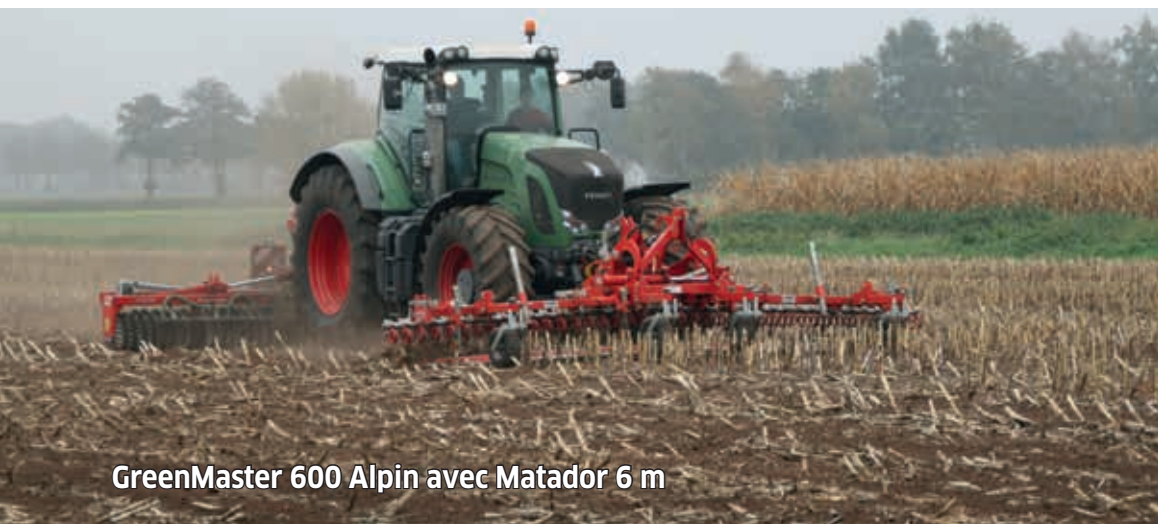
GreenMaster 600 Alpin avec Matador 6 m

Deux disques de diamètres différents travaillent côte à côte, pour un suivi de sol parfait et un autonettoyage efficace du rouleau prismatique®!